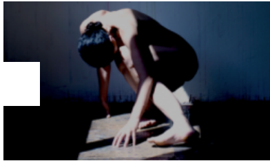
Photographie «Féminin – Masculin n° 26