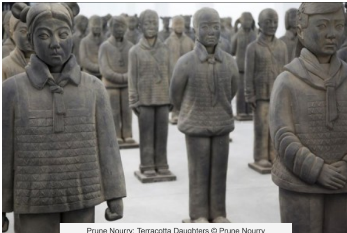
Prune Nourry: Terracotta Daughters © Prune Nourry

L'exposition part ensuite en tour du monde en 2014, avec une étape à Paris en avril, puis en Suisse en juin avec la commissaire d'exposition Tatyana Franck, à New York en octobre avec la FIAC pour le festival Crossing the Line et en Amérique en décembre.