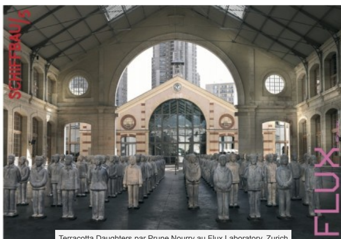
Terracotta Daughters par Prune Nourry au Flux Laboratory, Zurich

La Chine et l'Inde représentent à elles seules 1/3 de la population mondiale et présentent un même déséquilibre entre les sexes. Ce phénomène sociologique s'explique par le fait qu'en Chine, les parents souhaitent en majorité avoir un fils plutôt qu'une fille. Le nombre d'hommes célibataires n'a fait qu'augmenter depuis les années 1980 et la mise en service des échographies, permettant aux parents de connaître à l'avance le sexe de leur future enfant. Ce phénomène a des répercussions désastreuses sur la situation des femmes en Asie (kidnappings d'enfants et de femmes, mariages forcés, prostitution, migration des populations...).